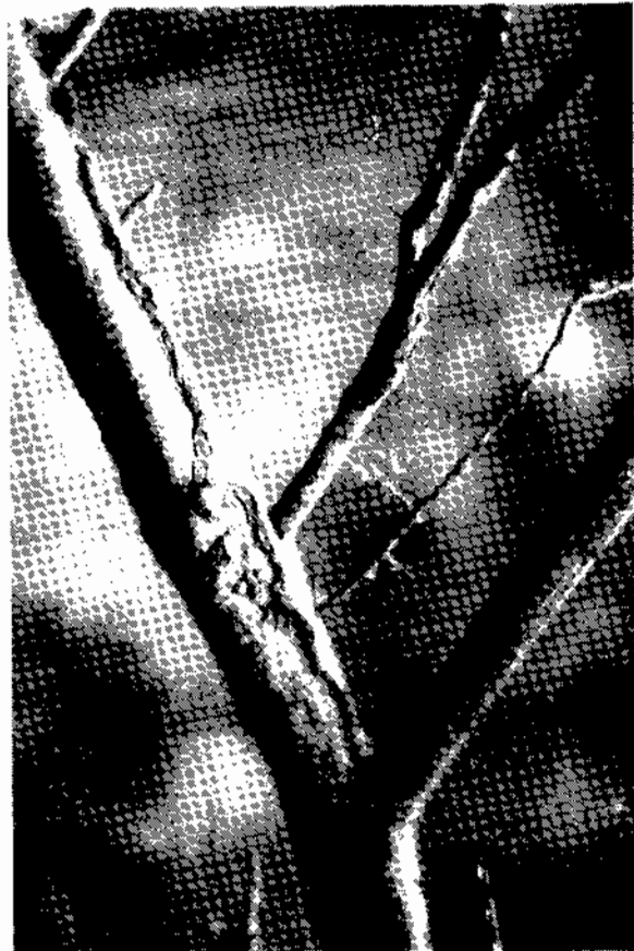
Photo 3 - Dégâts de charançons non cicatrisés sur racines de Citrange Carrizo.